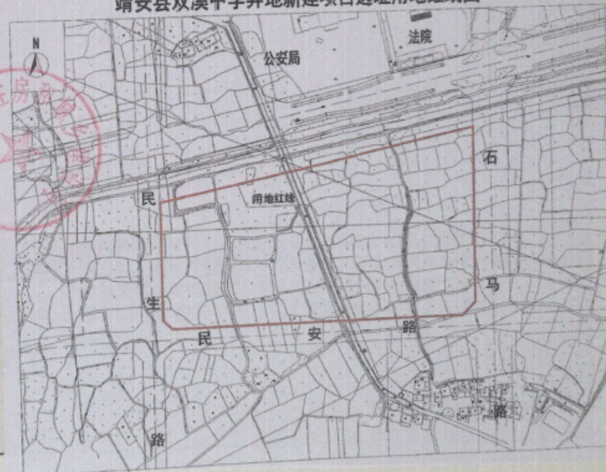
靖安县双溪中学异地新建项目选址用地红线图